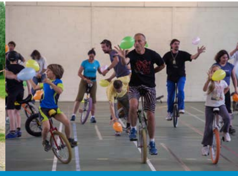
L'initiation et l'apprentissage du monocycle se font souvent par le jeu