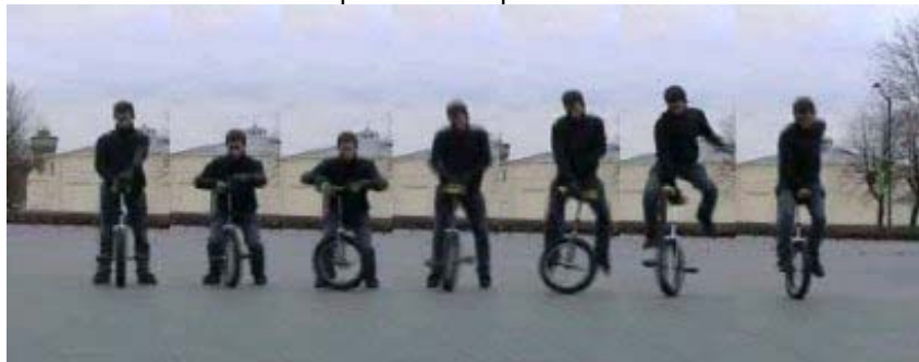
montée 360 uni spin

Montée 360 uni spin : on se place derrière le mono, main gauche sur l'avant de la selle et la main droite sur l'arrière droit de la selle, les pédales bien horizontales. Sauter et commencer la rotation du mono dans le sens inverse des aiguilles d'une montre. Quand vous serez à la moitié de la rotation, ramenez votre main droite sur la partie avant gauche de la selle (attention elle se retrouve à l'envers) et vous pouvez recaler la main gauche, puis atterrir des deux pieds sur les pédales.