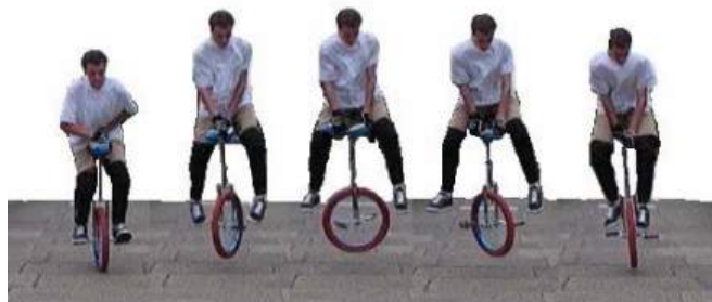
180 uni spin

180/360 uni spin (en roulant ou en statique) : là c'est le même principe que pour la montée mais vous prenez votre impulsion (pour le saut) sur les pédales du mono, pour une meilleure rotation, vous pouvez tenir la selle avec vos deux mains